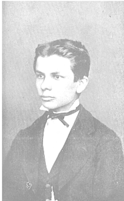
J.J. Fučík před maturitou r. 1878